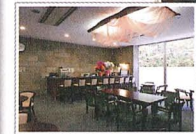
▲休息間 櫻香 Lounge Ouka