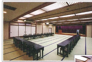
▲大宴會餐廳 Main banquet hall

The hotel features a nostalgic Japanese flavor with the concept of beautiful cherry blossom. A warm welcoming hospitality awaits you from the moment you arrive to suit your fancy.