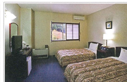
▲主館 西式(雙人間) Western-style room in the main building Twin room