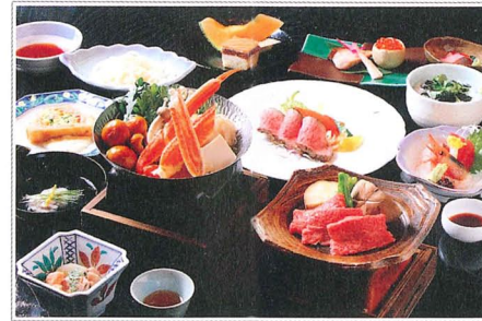
※照片中為宴會料理 (照片僅供參考) The pictures are intended for illustrative purposes only