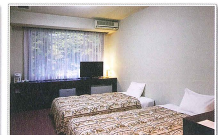
▲分館 西式(雙人間) Western-style room in the annex Twin room