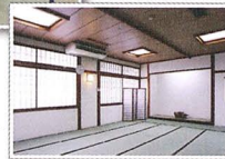
小宴會餐廳 Banquet room